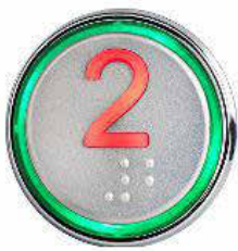
KLASYCZNY PANEL DYSPOZYCJI – Klasyczny panel sterowania jest wyposażony w podświetlane przyciski przystanków PRZYCISK KASETY Z BRAILLEM – POGLĄDOWA KONFIGURACJA