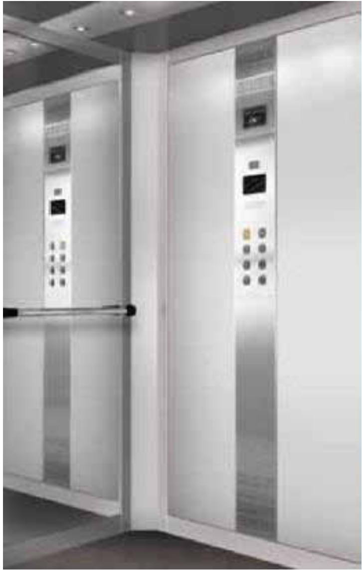
KABINA – POGLĄDOWA KONFIGURACJA